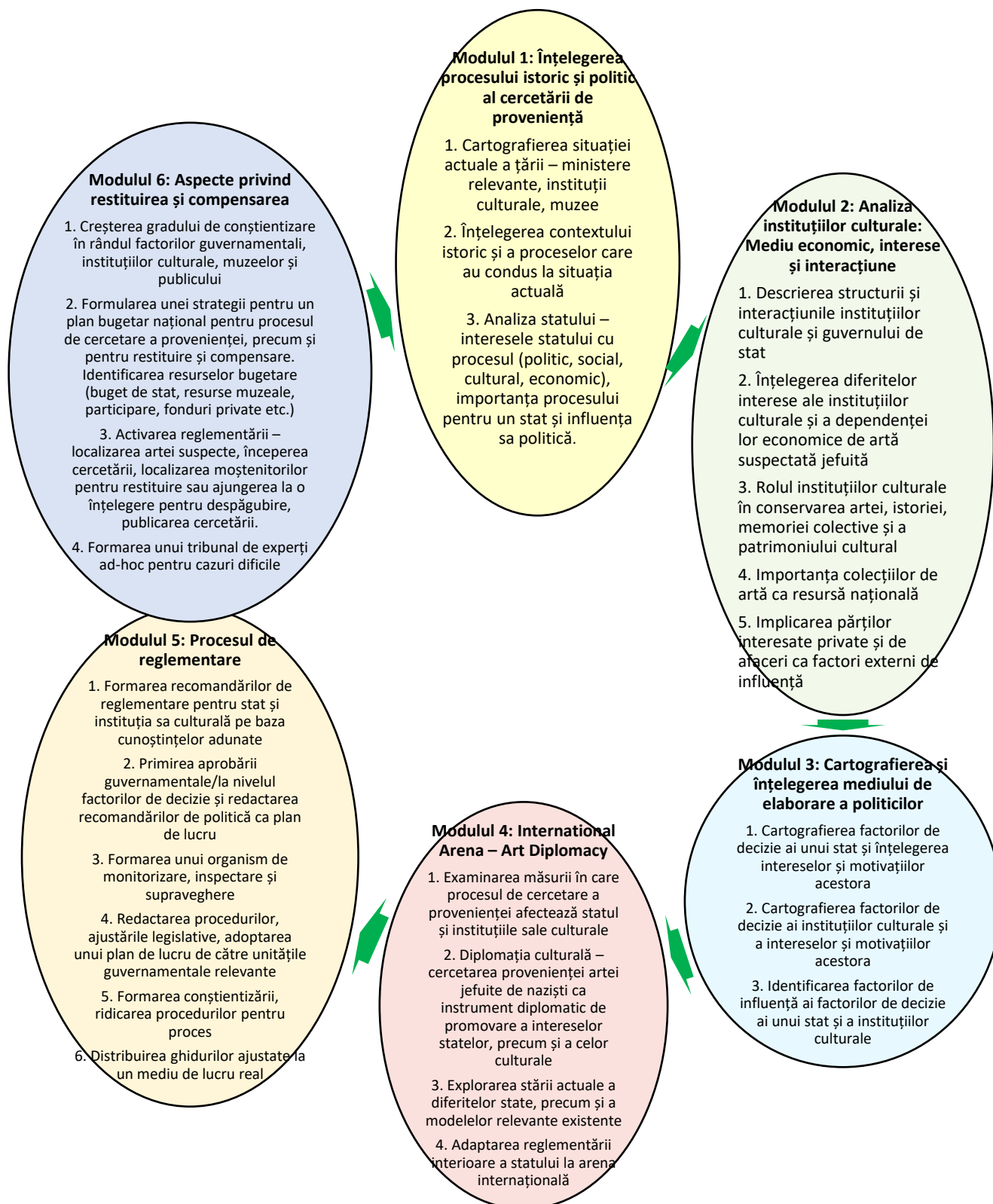
Figura 5.2 Modelul statului european pentru politica de cercetare a provenienței a artei

jefuite de naziști/Artei jefuite de naziști a proprietății evreiești