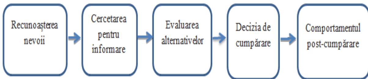
Figura nr. 1: Etapele procesului decizional

fiind diferit. Trecerea de la hotărârile considerate a fi simple (spre exemplu, achiziția produselor de strictă necesitate) la cele care au un caracter complex (alegerea unei locuințe, a unei mașini, alegerea școlii pe care o urmează sau locul de muncă pentru care aleg să opteze) are loc în mod permanent în viața unui individ. Expunerea la informațiile provenite din mediul înconjurător și provocările cotidiene din existența persoanei o determină să realizeze o prioritizare a deciziilor ce urmează a fi luate. În mod similar, cele mai multe sarcini se îndeplinesc prin realizarea unor achiziții. Astfel, în funcție de complexitatea acestora, consumatorul stabilește o etapizare a procesului de cumpărare, de cele mai multe ori demersul presupunând parcurgerea a cinci etape (Figura nr. 1) (Schiffman și Wisenblit, 2015; Kardes et al., 2015; Madsen, 2018).