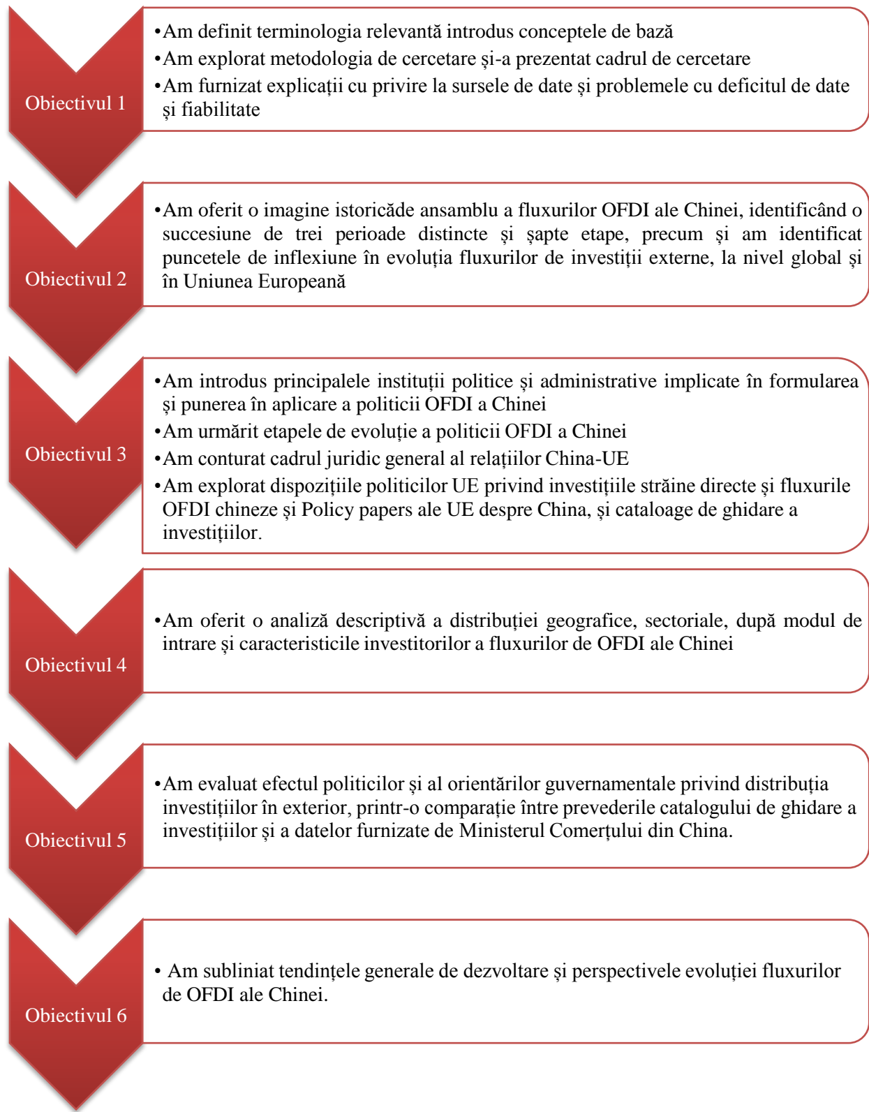
Figura 2. Sumarul obiectivelor de cercetare