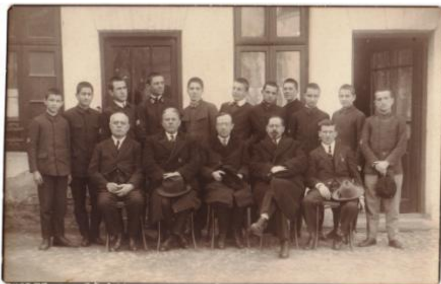
Fig. 1.5. Amintire din clasa a VI-a modernă a Liceului 'Spiru Haret' din anul 1926