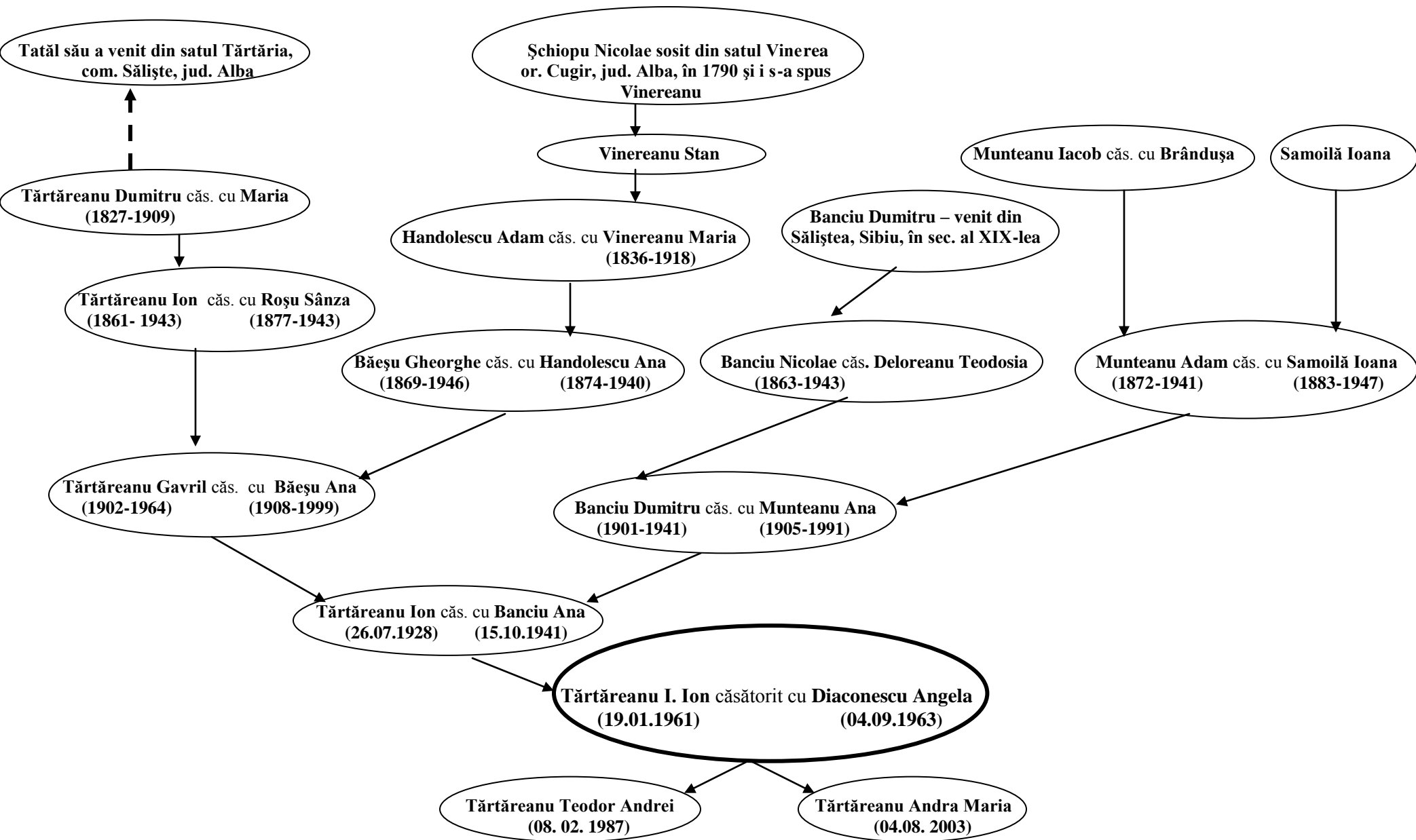
Fig. 2 - Arborele genealogic al lui Tărtăreanu I. Ion din Vaideeni, județul Vâlcea