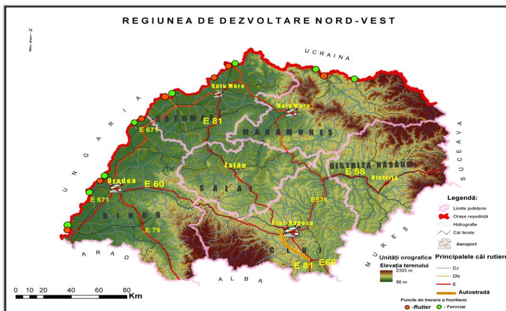
Major administrative units and the distribution of transport infrastructure land and air

The North-West development region of Romania, overlaps territorial administrative units of the northwest, aligned to the counties of Cluj, Bihor, Sălaj, Satu Mare, Maramureș and Bistrița-Năsăud (Fig.1), covering 14, 32% of the national territory is composed of 445 administrative units, of which 43 are urban, and the difference of 402 administrative units communal type(bigger villages), units that manage a total of 1800 villages, there are between them both differences and disparities in development.